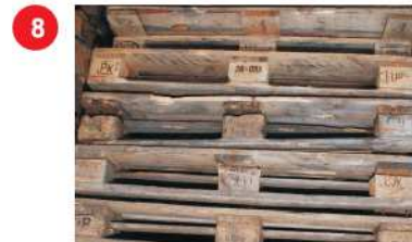
8 Ogólnie zły stan techniczny, np.: - trwałe zanieczyszczenie (np. olej, cement, smar); - wykorzystanie niedopuszczalnych elementów konstrukcyjnych - desek, wsporników, gwoździ; - złe pozycjonowanie elementów, np. wspornik przesunięty względem desek.

Palety z wadami niedopuszczalnymi można naprawić (jeśli to możliwe) lub poddać utylizacji.