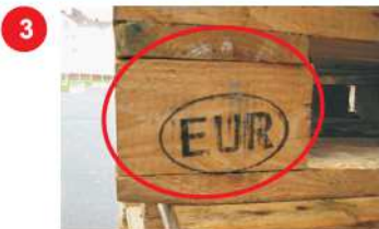
3 Nieprawidłowe oznakowanie na wspornikach.