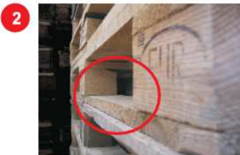
2 Brak frezów na górnych krawędziach desek dolnych.