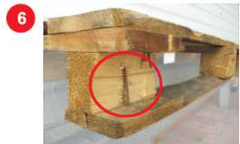
6 Wspornik z odłupaniem ukazującym choćby jeden gwoździ