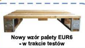
Nowy wzór palety EUR6 - w trakcie testów