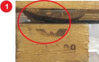
1 Ofis (oblina, odłupanie) wzdłużnic (środkowej i bocznych)