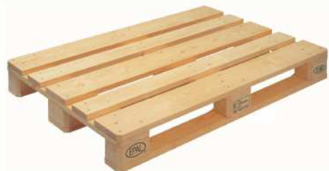
PALETA EUR (800x1200 mm)

Poszczególne typy palet różnią się konstrukcją i wymiarami, ale wszystkie spełniają te same, rygorystyczne normy wytrzymałościowe oraz są produkowane w oparciu o Kartę UIC 435.