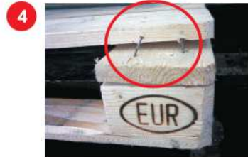
4 Deska z odłupaniem ukazującym dwa lub więcej gwoździ.