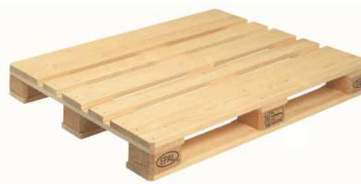
PALETA EUR3 (1000x1200 mm)

Wsporniki palet EUR mogą być wykonane z drewna litego lub rozdrobnionego.