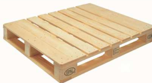
PALETA EUR2 (1200x1000 mm)