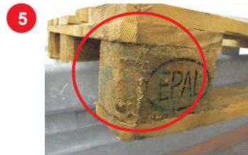
5 Ślady zbutwienia, zagrzybienia bądź próchnicy. Takie palety należy poddać utylizacji.